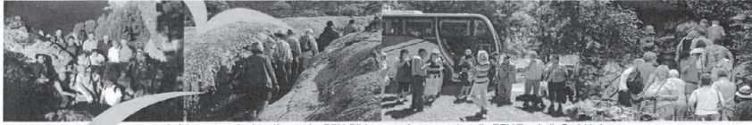
Auf Anregung der Landfrauen im BBV-Bildungswerk veranstaltet die BBV Touristik GmbH eine

Zur Anmeldung wenden Sie sich bitte bis 17.04. an die Ortsbäuerinnen: Sigrid Frankenberger 09372 2750 oder Christin Kessel 09372 9487371